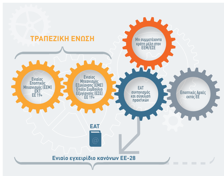
Σχήμα 1: Η ΕΑΤ στο πλαίσιο της τραπεζικής ένωσης

2015 και οι οποίες κάλυπταν τις τιτλοποιήσεις «πραγματικών πωλήσεων» και τις σύνθετες τιτλοποιήσεις. Στις συστάσεις της, η ΕΑΤ υπογράμμισε τη σημασία της αναδιάρθρωσης της αγοράς τιτλοποιήσεων για την ενίσχυση της εμπιστοσύνης των επενδυτών στα τιτλοποιημένα προϊόντα, την εξάλειψη της αντίληψης του στίγματος που περιβάλλει την αγορά τιτλοποίησης κατόπιν περιπτώσεων αθέτησης υποχρεώσεων σε σχέση με προϊόντα χαμηλής ποιότητας και υψηλού κινδύνου κατά τη διάρκεια της χρηματοπιστωτικής κρίσης, καθώς και για την παροχή εναλλακτικού διαύλου χρηματοδότησης στην πραγματική οικονομία. Επιπλέον, η ΕΑΤ πραγματοποίησε επίσης, από κοινού με την Ευρωπαϊκή Αρχή Κινητών Αξιών και Αγορών (ESMA) και την Ευρωπαϊκή Αρχή Ασφαλίσεων και Επαγγελματικών Συντάξεων (EIOPA), διαβουλεύσεις με τους συμφεροντούχους σχετικά με την αντιστοίχιση των αξιολογήσεων πιστοληπτικής ικανότητας που αποδίδονται στα προϊόντα τιτλοποίησης με τις βαθμίδες πιστοληπτικής διαβάθμισης που διατίθενται βάσει των κεφαλαιακών απαιτήσεων του κανονισμού CRR. Η ΕΑΤ εκπόνησε επίσης ουσιαστική ανάλυση σχετικά με τη διαφάνεια των αγορών τιτλοποίησης στην ΕΕ.